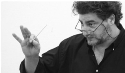
José Cura

Festiwal zainauguruje 9 maja 2015 r. w kościele Krzyża Świętego w parafii św. Heleny w Nowym Sączu prezentacja II Symfonii c-moll „Zmartwychwstanie” Gustava Mahlera w wykonaniu Chóru Polskiego Radia, Górecki Chamber Choir, Orkiestry Akademii Beethovenowskiej