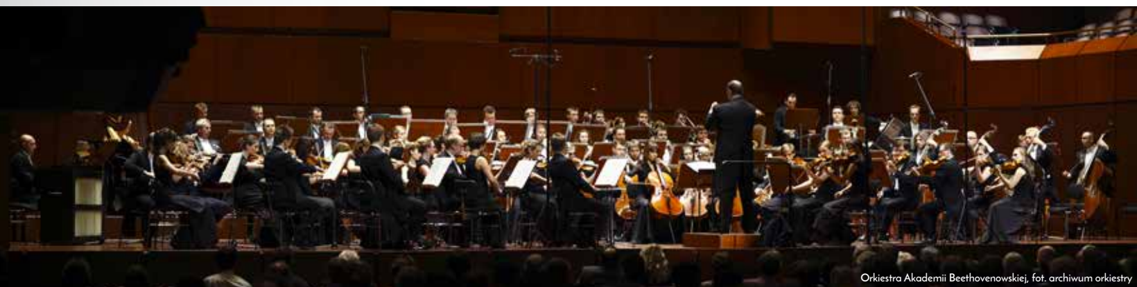
Orkiestra Akademii Beethovenowskiej

Mimo przewrotnie zastosowanego przez kompozytora przymiotnika „petite”, czyli „mała”, dzieło to rozmiarami niemal dorównuje „Wielkiej” Mszy h-moll Johanna Sebastiana Bacha. O znaczeniu utworu dla swego twórcy świadczyć może fakt, że jedyny raz w życiu poprzedził partyturę słownym komentarzem. Na jej końcu widnieje natomiast znamienne wyznaczenie kompozytora: „Dobry Boże! Oto ukończona ta biedna mała Msza. Nie wiem czy napisałem muzykę religijną (musique sacrée), czy muzykę potępną (sacré musique). Urodziłem się dla opery buffa i Ty wiesz o tym dobrze. Trochę wiedzy, trochę serca - i to wszystko. Bądź więc błogosławiony i przyjmij mnie do raju. G. Rossini, Passy 1863”.