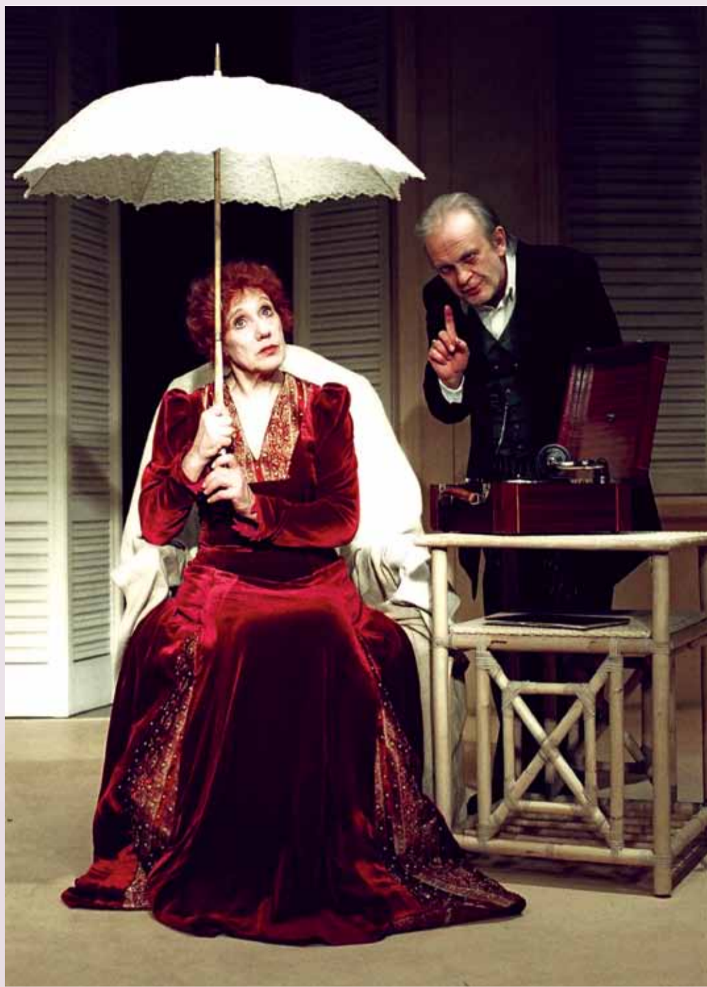
Maja Komorowska i Wiesław Komasa