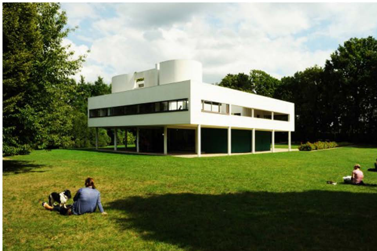
Le Corbusier, willa Savoye