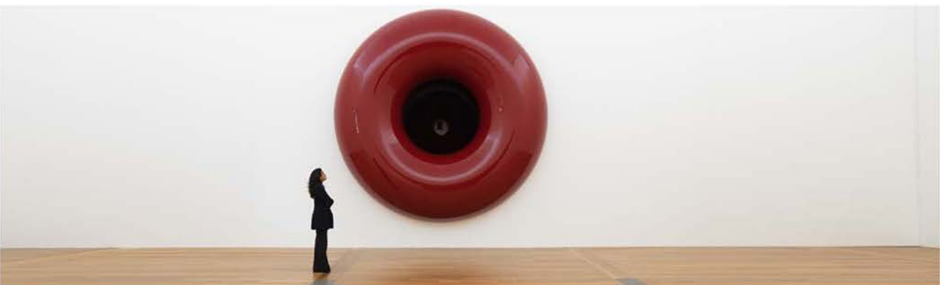
Anish Kapoor, Untitled 2006-2007