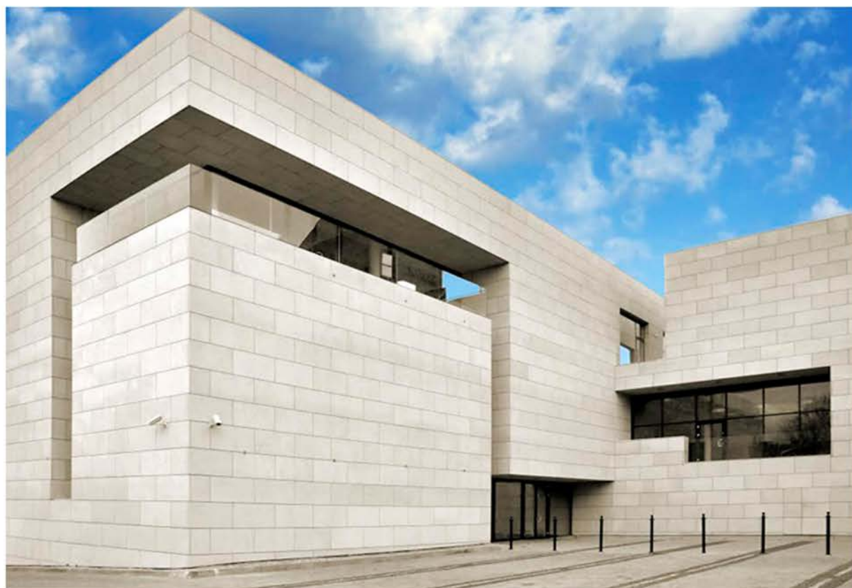
KKM KOZIEN Architekci s.c, BWA SOKÓŁ