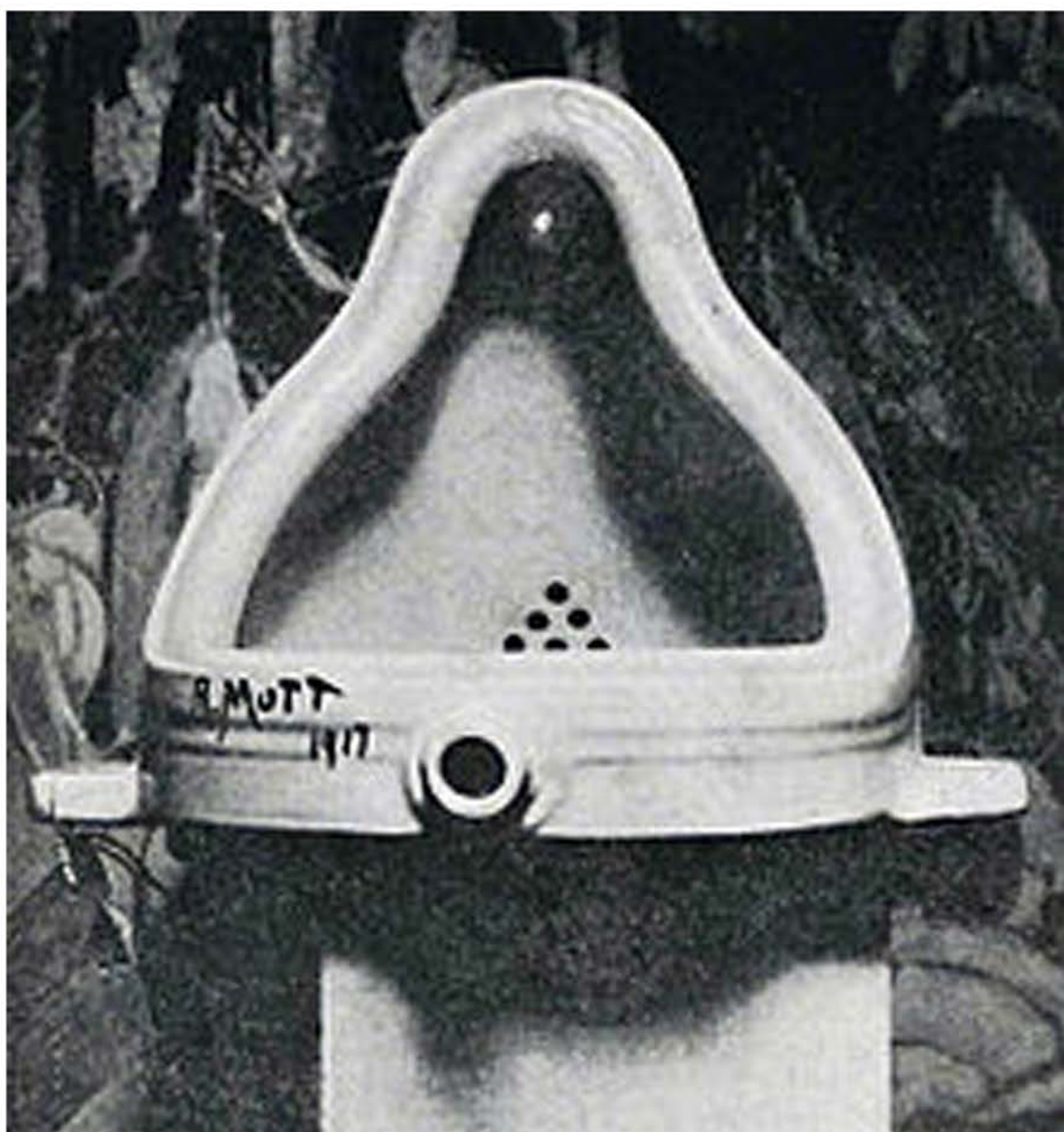
Marcel Duchamp, Fontanna