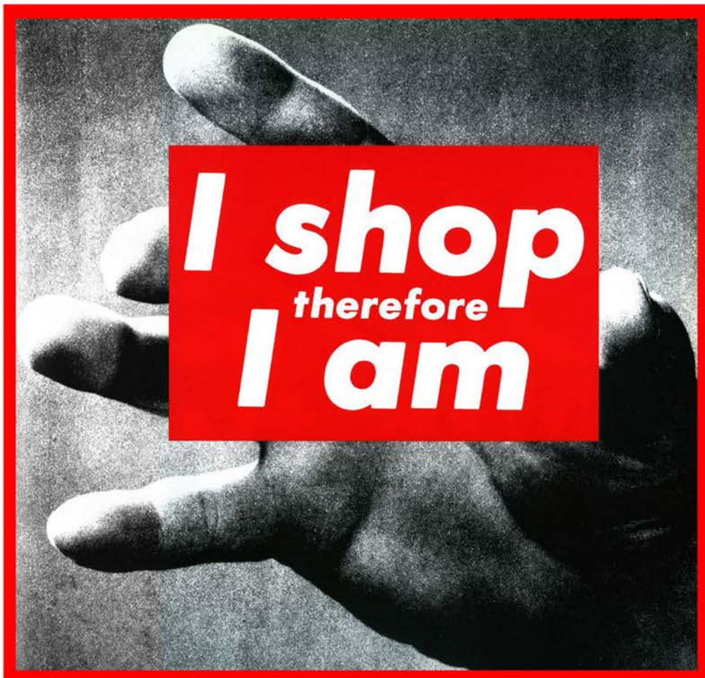
Barbara Kruger, I shop therefore I am