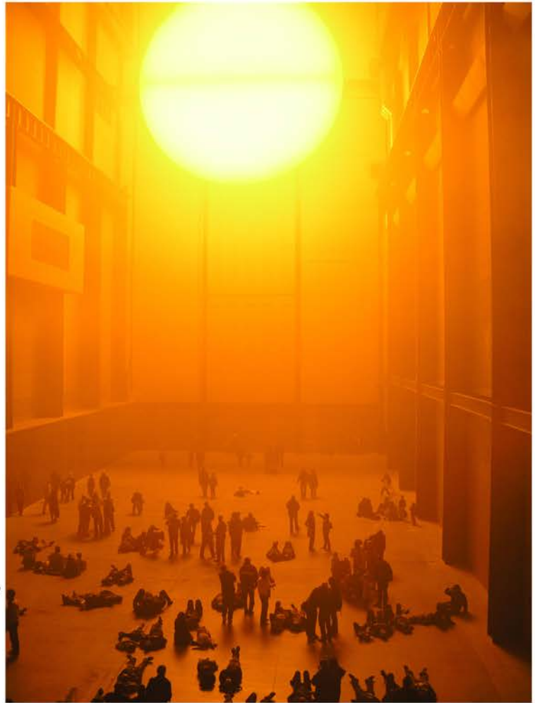
Olafur Eliasson, The Weather Project