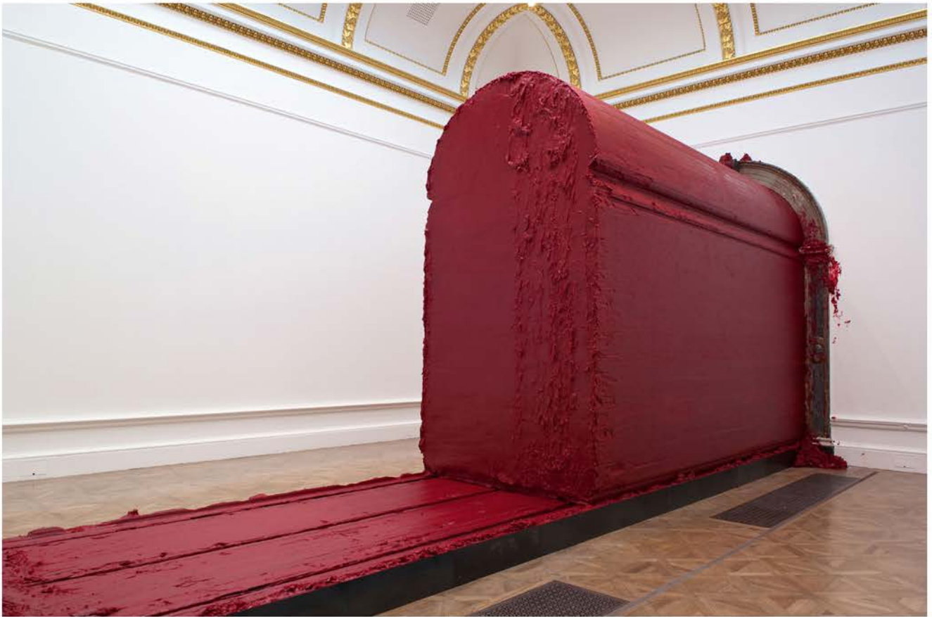
Anish Kapoor, Svayambh