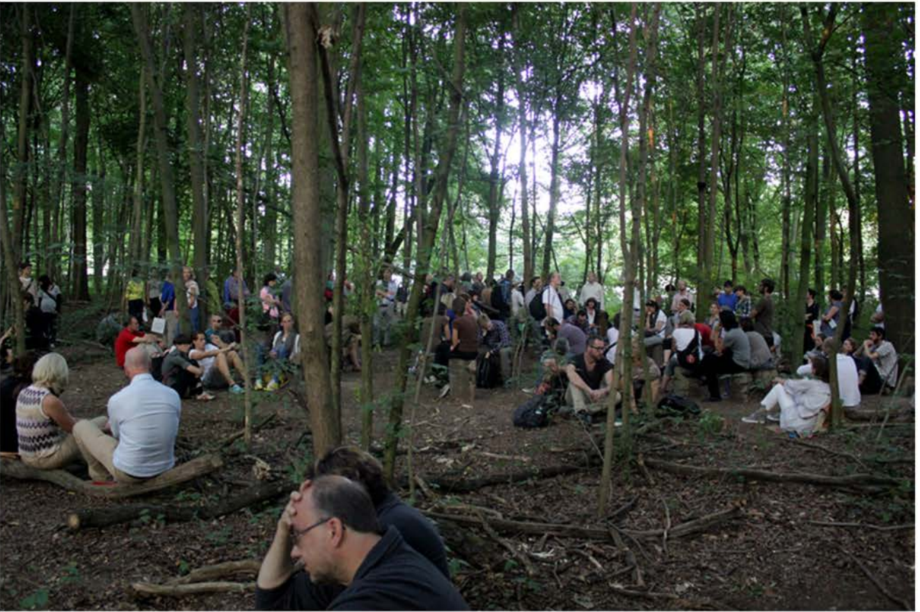
Janet Cardiff, Forest (las)