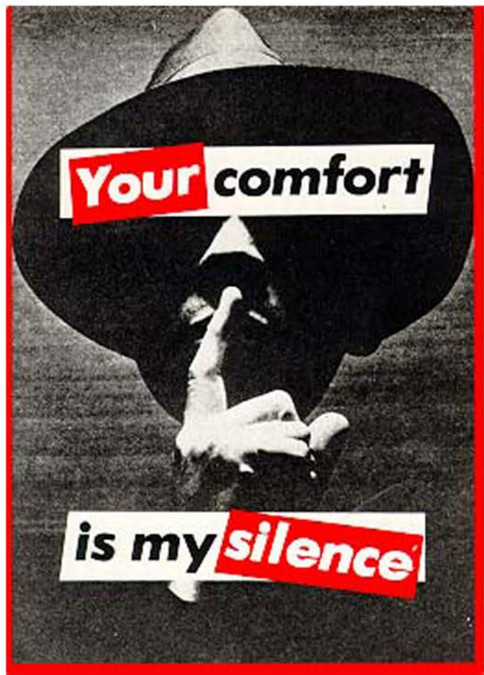
Barbara Kruger, Your comfort is my silence