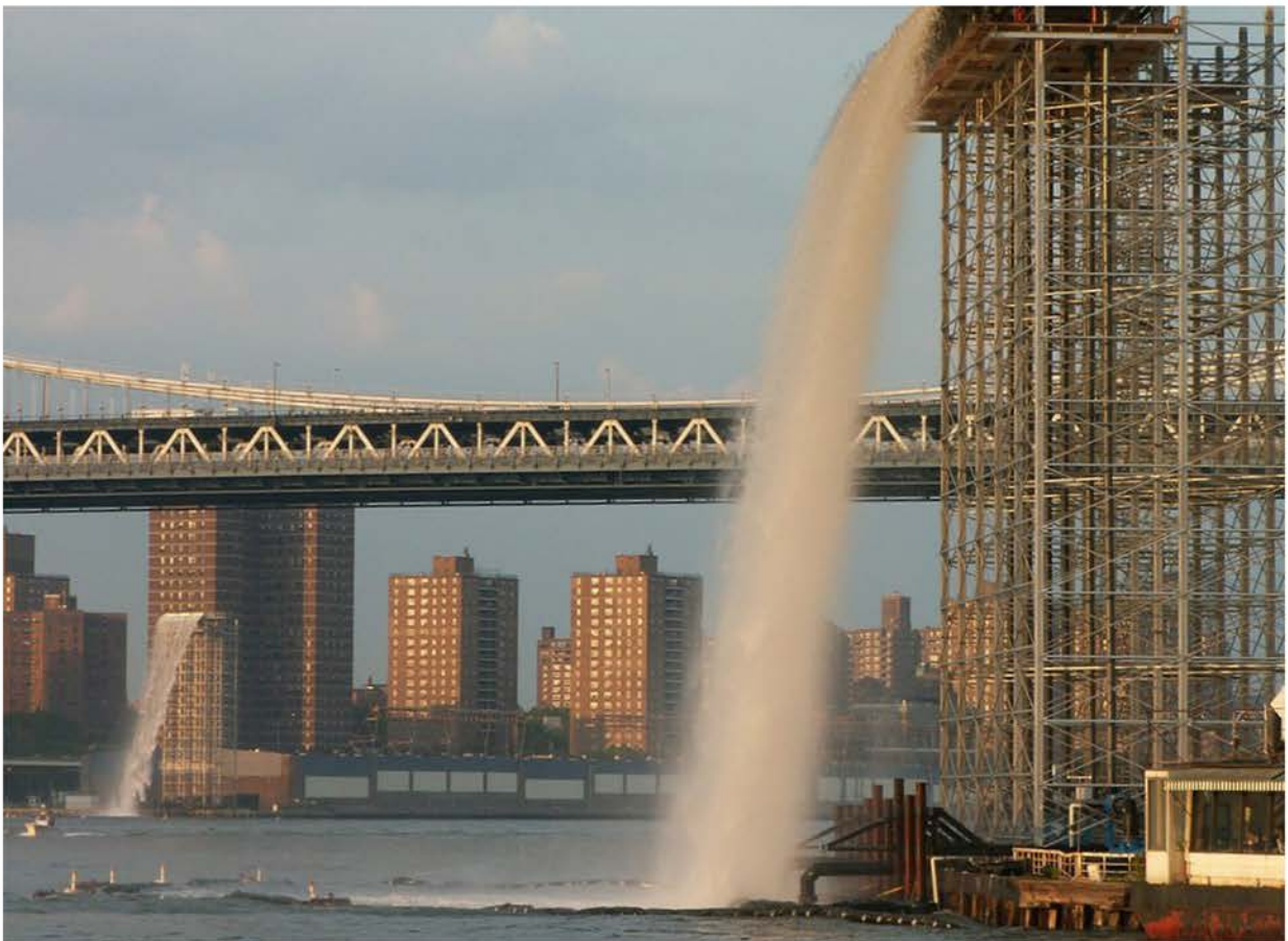
Olafur Eliasson, The New York City Waterfalls